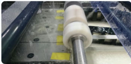
〈Edge 테스트 진행 모습〉